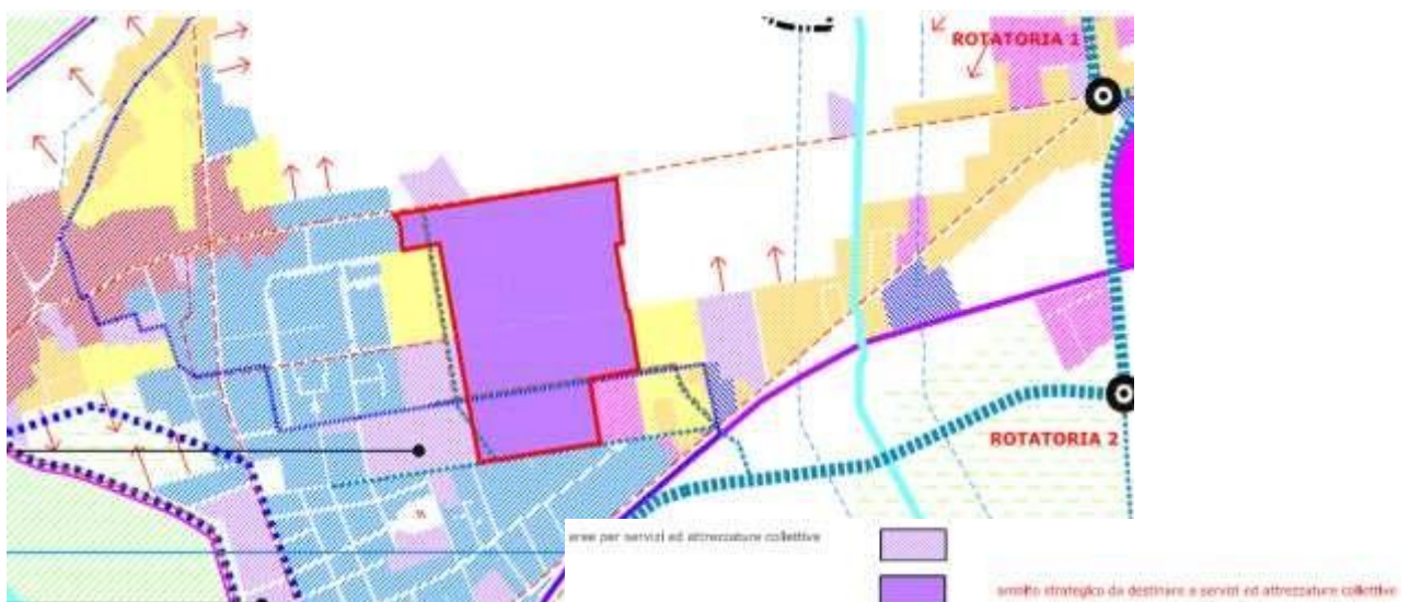
Stralcio del vigente Piano struttura